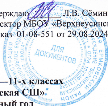
График оценочных процедур в 1—11-х классах МБОУ «Верхнеусинская СШ» на 2024-2025 учебный год